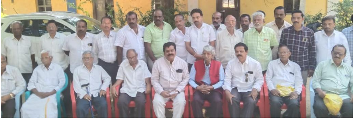
Senior Citizens Welfare Association Services of Rayachoti for Senior Citizens in AP