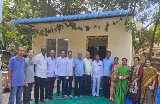
A newly built RWA office & ASARA (Senior Citizens) room, beside our community center is inaugurated in KPBH (Phase V) Colony Kukatpally.