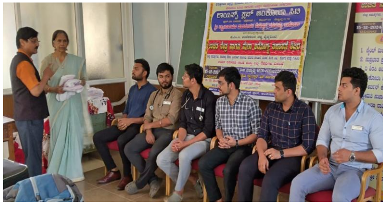
Medical camp at Ankola on 15 th December for the benefit of locals and tribals and for seniors by KMC Hospital, Manipal. Also, Multi-Speciality free medical camp at Ankola conducted along with Lions Club Ankola city and Kasurba Medical Hospital, Manipal.